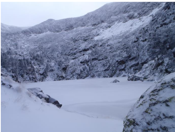
L'étang d'Auriol, 2250m, déjà gelé.