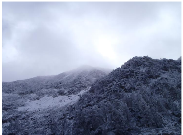
Au fond le pic d'Auriol, 2695m, d'accès pas si évident que cela.